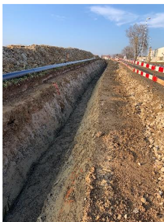
Verbindungsleitung Beromünster - Neudorf