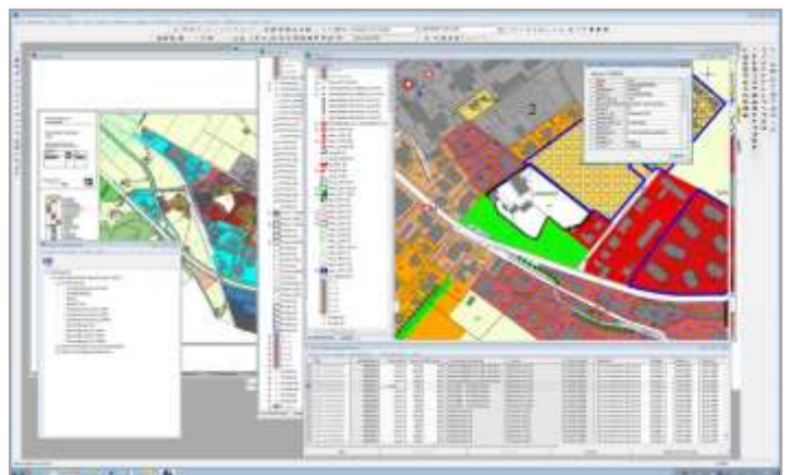
Erfassung im GIS-System gemäss Datenmodell RDP